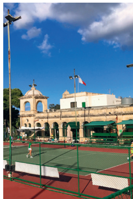
Marsa Tennis Club (Malta)